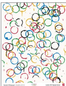
Affiche de 2012

À SAVOIR : La ville de Londres (Royaume-Uni) a reçu les Jeux Olympiques à trois reprises : en 1908, en 1948 puis en 2012.