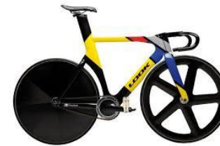
Un vélo de piste