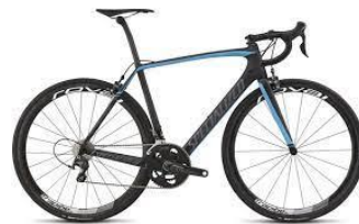
Un vélo de route