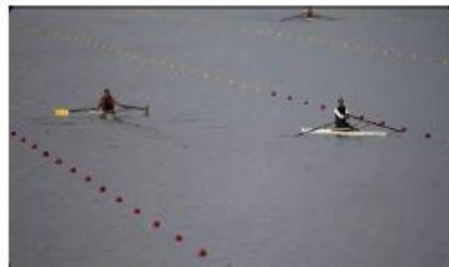
Un plan d'eau