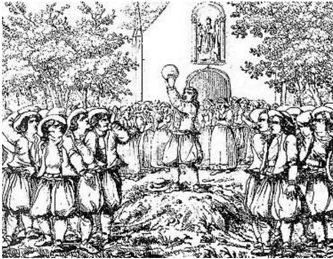
A l'époque de la Soule, village contre village.

Tous ces jeux évoluèrent en Angleterre jusqu'au début du XIXe siècle, date à laquelle le rugby prit naissance dans les collèges anglais qui formaient les jeunes gens issus de la haute société.