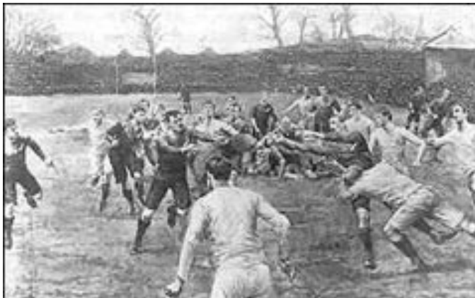
Les premiers matches de Rugby

(Dans le même temps une loi interdit le travail des enfants de moins de 9 ans et limite les horaires à 48 heures par semaine pour les jeunes de 9 à 13 ans et à 69 heures pour ceux de 13 à 18 ans ! On comprend que les ouvriers ne fassent pas de sport après de telles semaines de travail et que le rugby soit resté longtemps le privilège d'une catégorie de personnes).