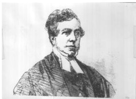
William Webb Ellis

La légende veut que le Rugby ait pris naissance au Collège de Rugby (Angleterre), ce jour de Novembre 1823 où un élève du nom de William Webb Ellis se mit à courir avec le ballon dans ses bras, au cours d'une partie de Football.