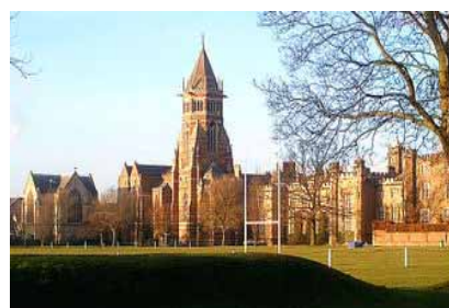
Collège de Rugby

Les origines du rugby sont sans doute plus lointaines.